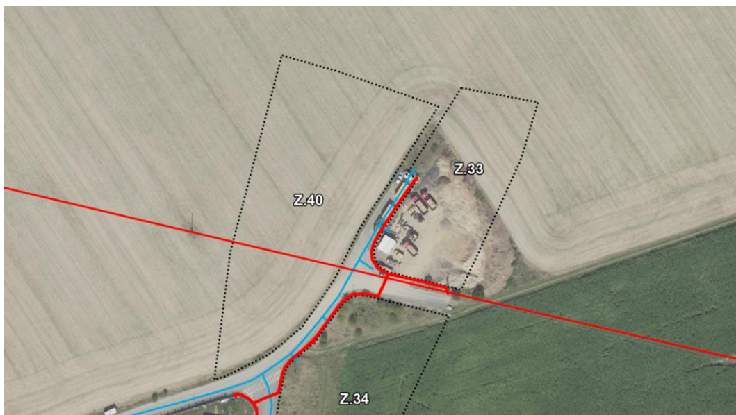
Obr. 1: urbanistický kontext plochy Z.40 a její napojení na veřejnou infrastrukturu

„Zastupitelstvo městyse Škvorec prohlašuje že v případě podání žádosti majitelem pozemků p. č. 298 a 301 v k.ú. Třebohostice u Škvorce o změnu funkčního využití na bydlení do změny č. 3 územního plánu tuto změnu podpoří jakožto protislužbu za prodej části pozemku p. č. 304 za účelem vedení kanalizačního přivaděče a vytvoření polní cesty ze Škvorce ke škole v Třebohosticích.“