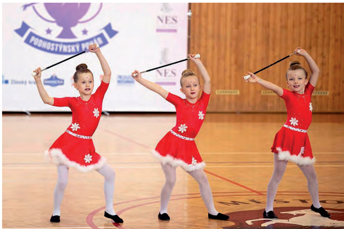
TRIO PODHOSTÝNSKÝ POHÁR