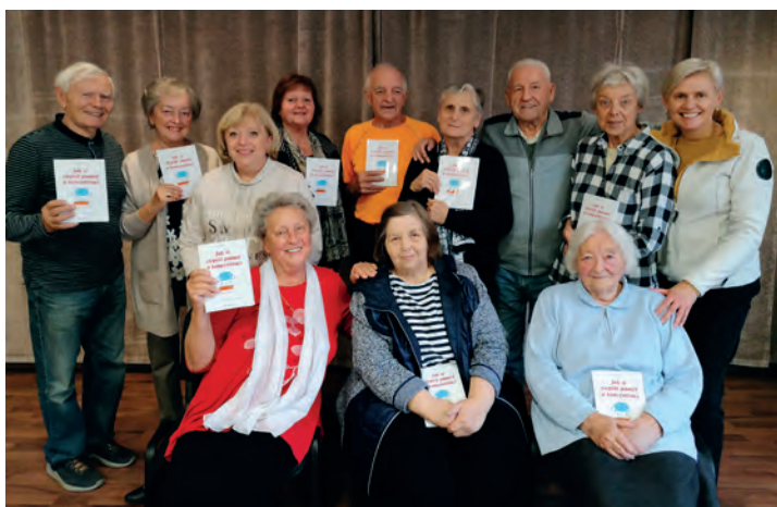
ÚČASTNÍCI INTELEKTUÁLNÍHO KLÁNÍ

Univerzita třetího věku VU3V je v plném proudu a nám se blíží konec semestru, který končí v prosinci. Přihlášky a informace o studijních tématech pro příští semestr získáte na městském úřadě. Kdo máte otevřenou mysl, přijďte mezi nás.