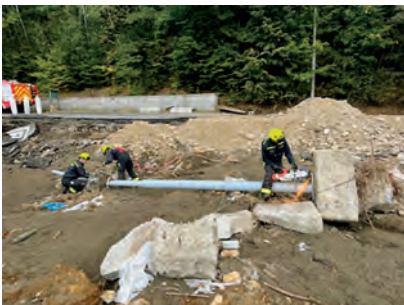
ŠKVOREČTÍ HASIČI NA JESENICKU

Výnos ze sběru železného odpadu ve výši 35 130 Kč jsme využili na pomoc lidem postiženým povod-