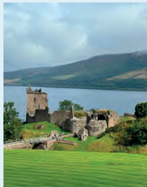
U JEZERA LOCH NESS

Odpoledne jsme se nalodili na trajekt do Velké Británie. Po vylození jsme navštívili hrad Alnwick, kde se Harry Potter učil létat na koštěti, a viděli jsme na vlastní oči lodní výtah Falkirk Wheel. Pak už nás čekalo rozdělení do skupinek a ubytování v hostitelských rodinách, které nás mile přivítaly, připravovaly pro nás svačinky na cesty a anglické večere. Poznali jsme lépe místní život a procvičovali si denně angličtinu.