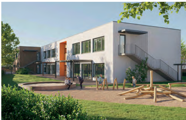
VIZUALIZACE NOVÉ MATEŘSKÉ ŠKOLY