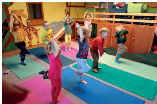
JÓGA S MÍŠOU