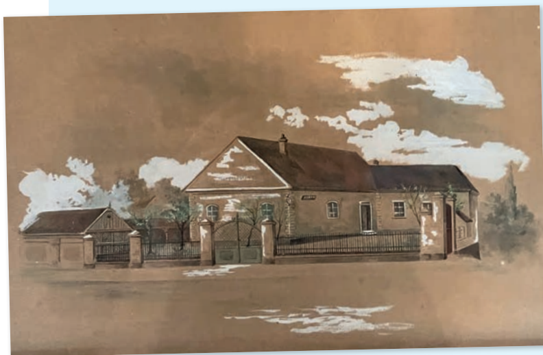
PODOBA HOSPODY PŘED ROKEM 1905