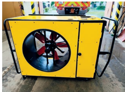
PĚNIK, AGREGÁT NA LEHKOU PĚNU

Aktuálně jsme dokončili náš dlouholetý projekt agregátu na lehkou pěnu, který jsme před několika lety objevili na sběrném dvoře v Nové Pace. Desítky hodin práce a nespočet požadavků po zakázkových dílech se vyplatily – „Pěnik“ je konečně hotový! První hasičskou