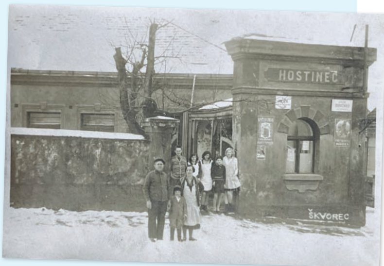
HOSTINEC U VACKŮ V ZIMĚ 1929/30

V roce 1988 byla hospoda uzavřena – táta Vacek a máma Vacková už provoz nevládali kvůli nemoci a vyčerpání z neustálého provozu. Pan Vacek tedy začal plánovat přestavbu prostor na byt pro sebe a svou rodinu. Přišla sametová revoluce a ani po