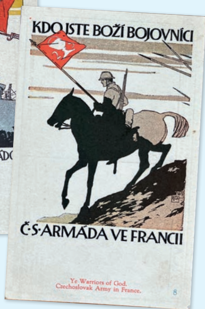
NÁBOROVÉ LETÁKY DO ČESKOSLOVENSKÉ ARMÁDY DISTRIBUOVANÉ V AMERICĚ