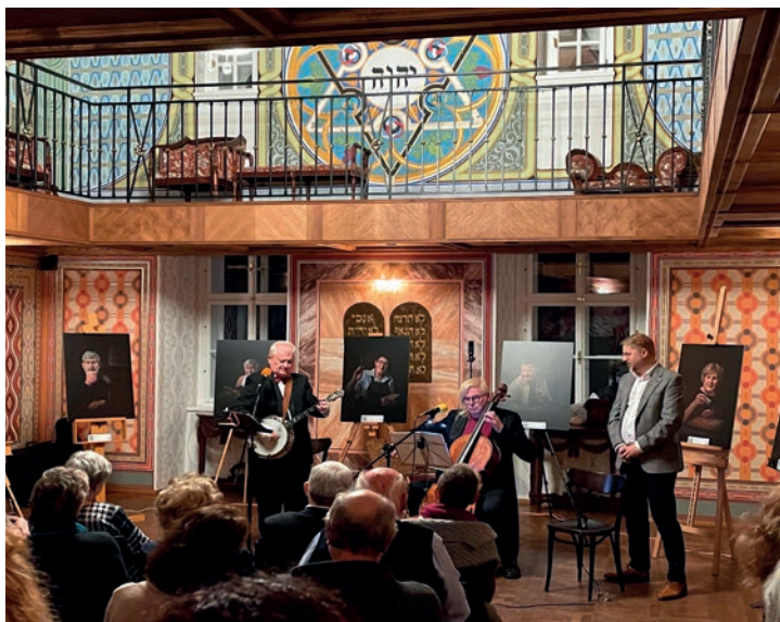
VERNISÁŽ V PROSTORÁCH ZÁMKU SAVOIA