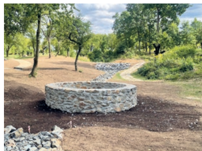
VIŠŇOVKA V NOVÉM

Než spustíme realizaci obou projektů, která bude rozdělena na několik etap, bude to ještě nějakou dobu trvat. Jsme závislí na možnostech čerpat dotace, nebo stavebním řízení, které třeba v případě Třebohostic také nebude nejkratší. Chceme vám všem velice poděkovat za opravdu velkou účast v této anketě. Máme radost, že vám není lhostejné, jaké projekty pro vás vedení městy připravuje a vaši zpětné vazby si velice vážíme. Ačkoliv nejde o referendum a výsledky nejsou pro stávající nebo budoucí zastupí-