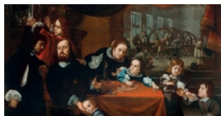
Každodenní život v barokních Čechách a na Moravě

Zní to skvěle, že? Už teď se těšíme, kam nás tahle historická cesta zavede.