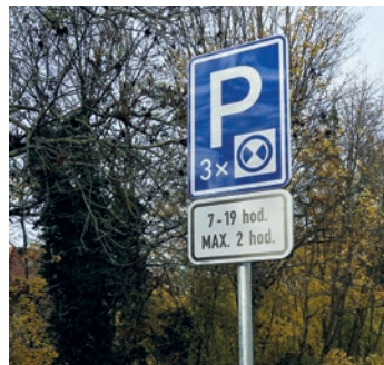
ZNAČENÍ PARKOVÁNÍ U SOKOLOVNY