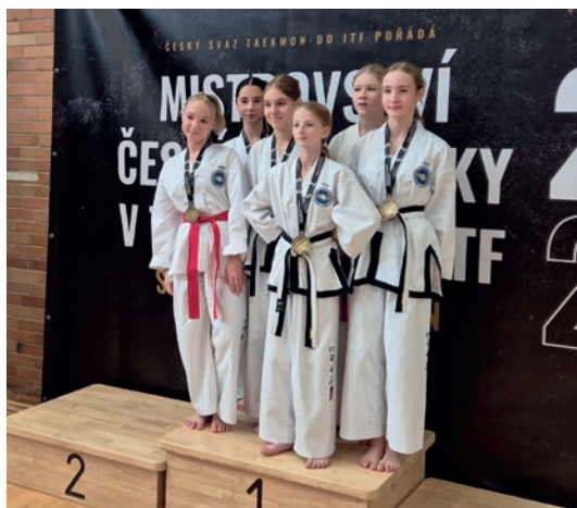
VÍTĚZOVÉ ZE ŠKVORCE

Pokud byste i vy měli zájem zlepšit svou kondici, naučit se praktickou sebeobranu či zasoutěžit si třeba i na mistrovství republiky, neváhejte se k nám ve čtvr-