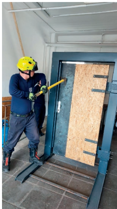
STÁŽ HZS 2025