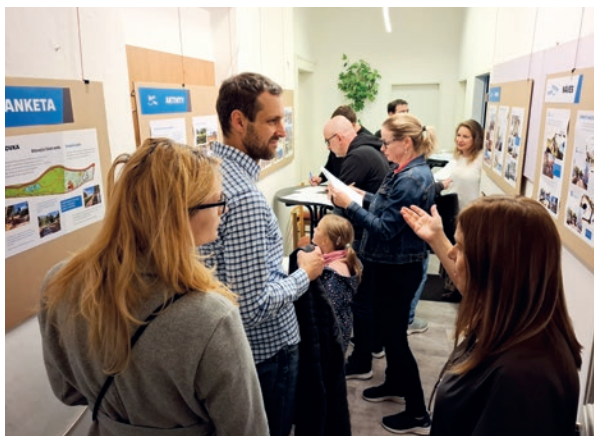
HLASOVÁNÍ OBYVATEL NA MĚSTSKÉM ÚŘADĚ

Občané celé obce se vyjádřili k nově vznikající podobě Višňovky a třebohostické návsi. V prvním kole ankety hlasovalo ani ne 15 % obyvatel, ve druhém kole, které proběhlo u příležitosti voleb do Poslanecké sněmovny, jich však svůj názor vyslovilo o bezmála 30 % víc.