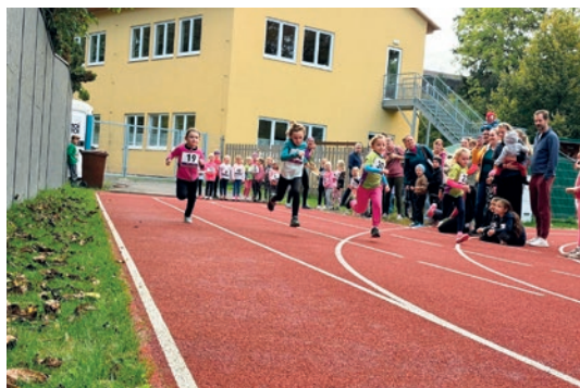
ATLETICKÝ TROJBOJ A ČTYŘBOJ

V rámci Českého atletického svazu jsme se zapojili do akce: Tréninky pro rodiče s dětmi zdarma, kdy jsme na jaře uspořádali tři tréninky pro rodiče s dětmi. Tato akce měla veliký ohlas a budeme v ní pokračovat i příští rok. Další akce byla zaměřena na starší děti, jmeno-