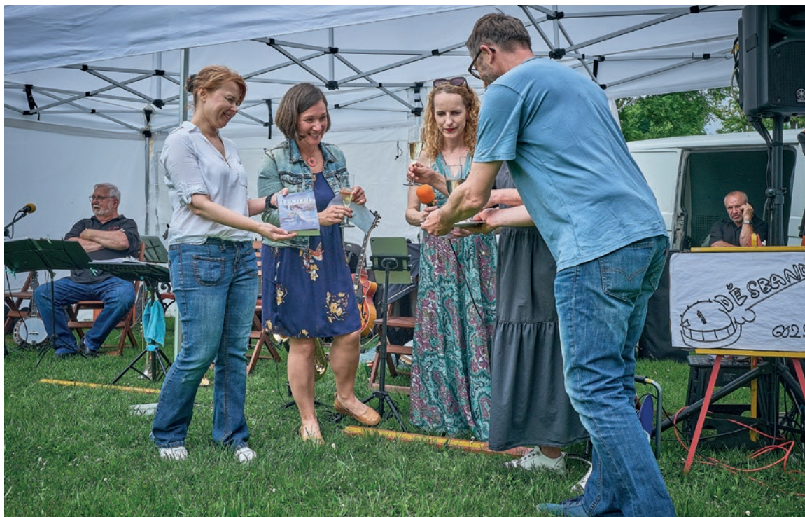
KŘEST KNIHY NA INTERNATIONAL DAY