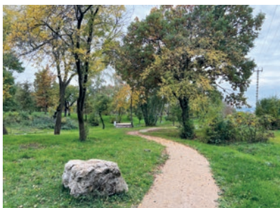
NOVÉ CESTY VE VIŠŇOVCE

Z náměstí se vydáme po žluté turistické značce směrem přes staré koupaliště údolím Škvoreckého potoka Na Dolíkách. Cestou narazíme na dvě zajímavé pamětní desky. První připomíná Svatopluka Čecha a pochází z roku 1909, druhá je trochu nenápadná, schovaná v křoví. Pokračujeme dál údolím až k poslednímu rozcestí, kde žlutá značka odbočuje vlevo na Doubek. My se však držíme