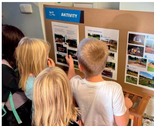
HLASOVÁNÍ ŽÁKŮ NA ZÁKLADNÍ ŠKOLE

V průběhu října jsme pro všechny občany s trvalým bydlištěm ve Škvorci a pro všechny vlastníky nemovitostí uspořádali anketu k budoucí podobě horní části nově vznikajícího parku Višňovka a k variantám řešení průjezdu návsi v Třebohosticích. Při poslední anketě o budoucí podobě Višňovky v roce 2021 hlasovalo pouze 15 % občanů a naším cílem tak bylo získat názory co největšího počtu obyvatel. Vzhledem k množství odevzdaných hlasovacích lístků máme pocit, že se to povedlo.