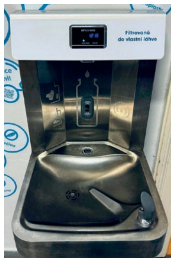
CHYTRÉ ZAŘÍZENÍ NA FILTROVANOU VODU